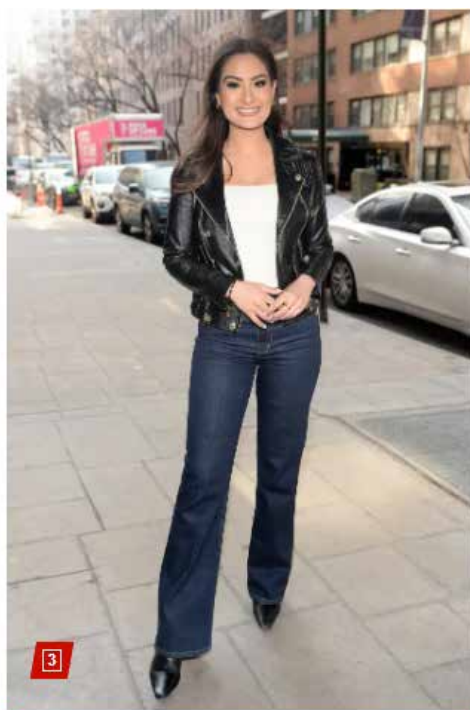
Millennial and Gen X faultfinders have blasted the uniformed look online.

Младите хора от Голямата ябълка обаче си спечелиха почти идентично порицание от виртуални циници, които също останаха разочаровани от съвпадащите им връхни дрехи.