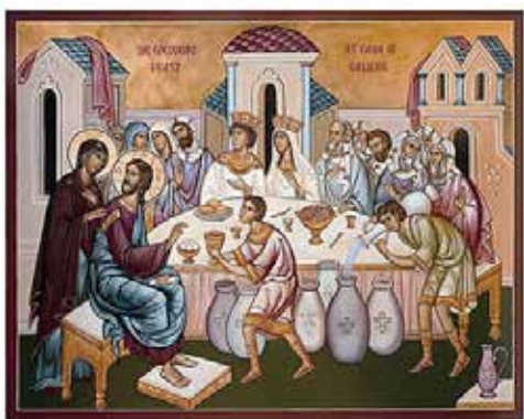
Господ Иисус Христос благославя младоженците в Кана Галилейска и извършва там първото Си чудо

Бог човека, по Божий образ го сътвори: мъж и жена ги сътвори.