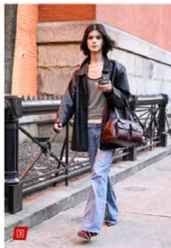
Critics have lambasted wannabe fashionistas nationwide for ditching their own personal styles to, instead, rock the divided "Gen Z uniform" comprised of jeans, a jacket, a fitted top and sneakers. Daily images

Поколение Z се облича в „скудни, банални униформи“ и с липса на личен стил