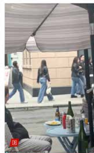
A group of Gen Z women were spotted on the streets of NYC wearing matching outfits days after they became influencers were virally branded as "boring" for dressing alike.

казва пред The Post, че „манията по копиране е форма на „асимиляция на модната идентификация“.